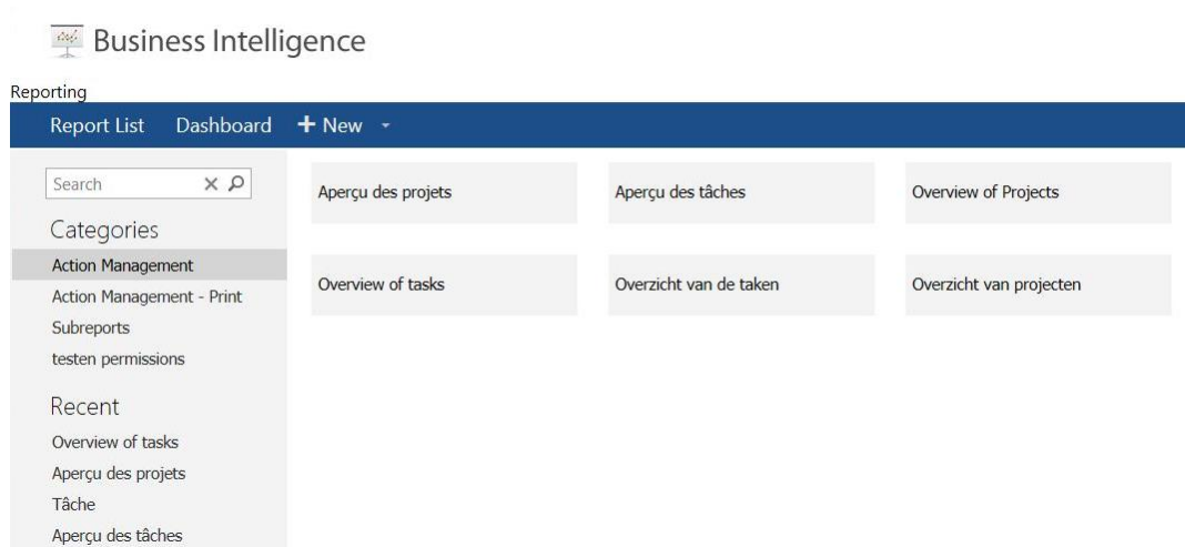
Screenshot: Hoofdpagina van Rapporten

Om Rapporten te openen, klikt u in het hoofdmenu op de knop Rapporten . Op het scherm verschijnt de hoofdpagina van Rapporten.